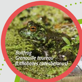
Bullfrog Grenouille taureau ( Lithobates catesbeianus )