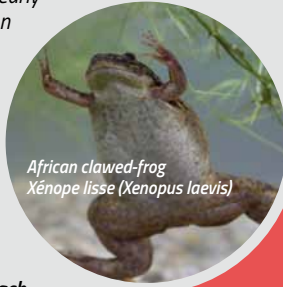
African clawed-frog Xénope lisse ( Xenopus laevis )